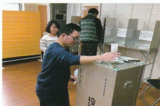
選挙の練習をやりました！