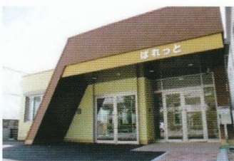
外から見たぱれっとはこんな感じです！