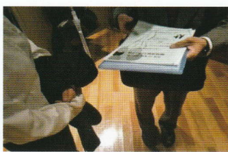
就職活動でマッチングセミナーに参加！