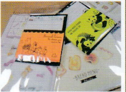
レターセット作っています♡