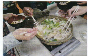
寒い季節はお鍋がおいしいですよ！