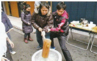
近くの事業所へ参加した餅つき大会！